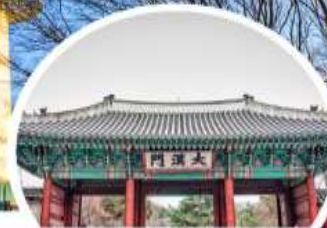
พระราชวังตึ๊ดอกชุกุง