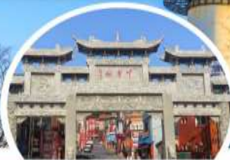
โซนน้าทาวน