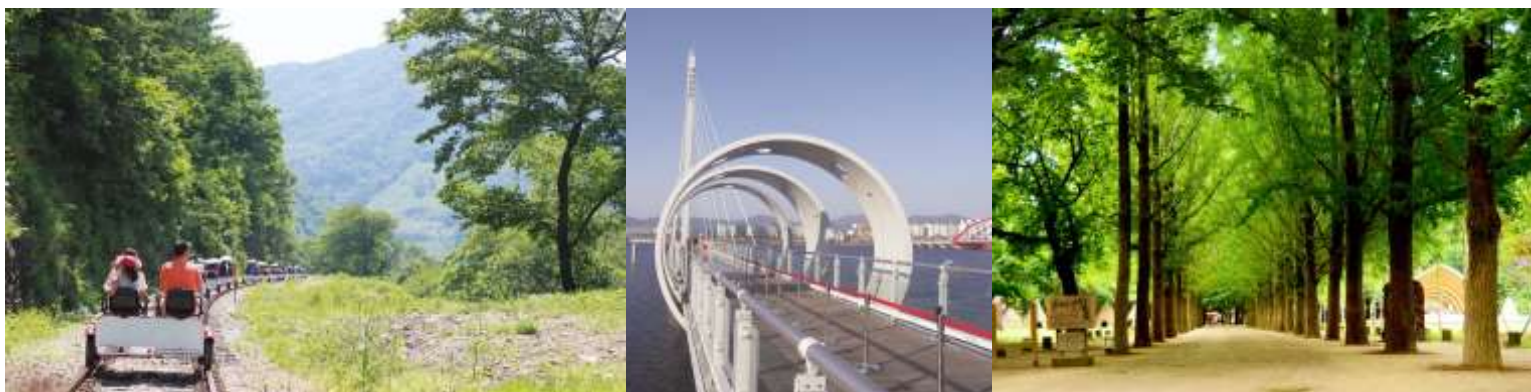
เครื่องเคียง